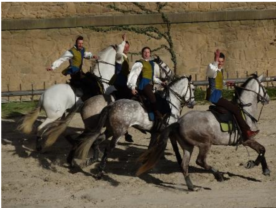
Au Puy du Fou